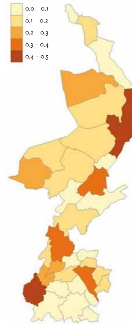
Figuur 2. Relatief aantal innovatieve bedrijven in Limburg per gemeente, gecorrigeerd voor de bevolkingsdichtheid

In praktijk worden meerdere modellen uitgetoetst, worden per model meerdere waarden van de modelparameters getest en wordt een feature -selectie uitgevoerd. De beste manier om een model te ontwikkelen bij supervised learning is om de dataset in tweeën te verdelen. Eén deel wordt gebruikt voor eenvoudige kruisvalidatie waarbij modelparameters worden getuned.